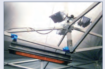
Beleuchtung mit Beheizung