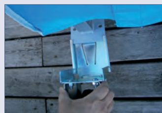
Fußrollen (1 Paar) zum Anstecken für bequemen Transport