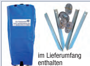
Transportsack mit Abspannset