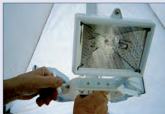
Beleuchtung 3x 150 W – nach unten oder nach oben gerichtet