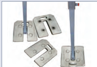
Fußplatte/Beschwerung á 15kg