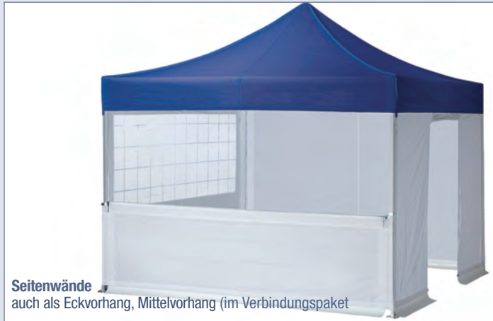
Seitenwände auch als Eckvorhang, Mittelvorhang (im Verbindungspaket)