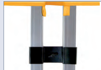
Zeltverbinder (im Verbindungspaket)