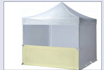
1/2hoch – Montage mit Querstange