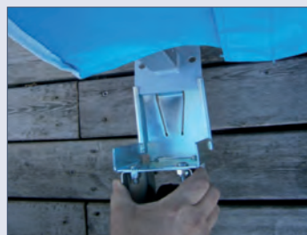
Fußrollen (1 Paar) ansteckbar für bequemen Transport