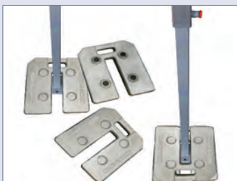
Fußplatte/Beschwerung á 15kg