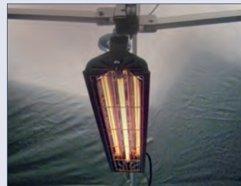
Beheizung 1.000 W