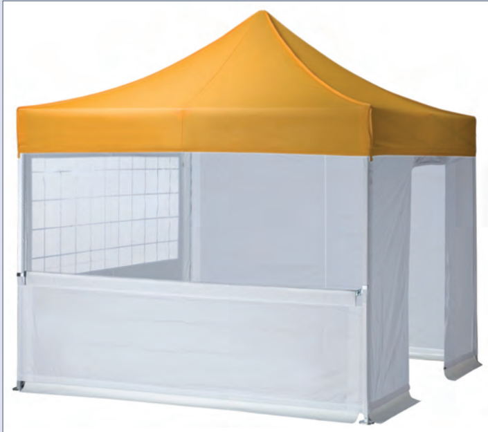
Seitenwände – verschiedene Ausführungen (auch in Eckvorhang-Variante)