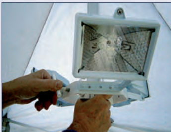
Beleuchtung 3x 150 W – nach unten oder nach oben gerichtet