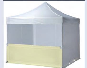
1/2hoch – Montage mit Querstange