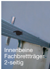
Innenbeine Fachbretträger 2-seitig